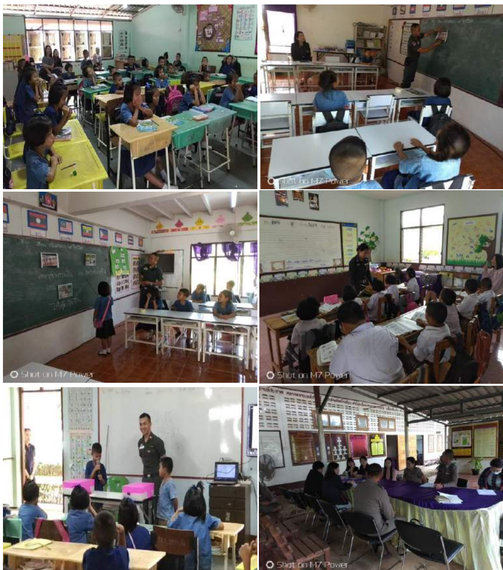
การนิเทศ ติดตาม สังเกตการสอน แนะนำแนวทางครูภาษาไทย