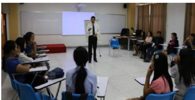
กิจกรรม PLC การสอนเด็กปฐมวัยในโรงเรียนตำรวจตระเวนชายแดน

การพัฒนาครูด้านการวัดและประเมินผลระดับปฐมวัย มีการดำเนินการให้ความรู้ เกี่ยวกับพัฒนาการเด็กปฐมวัย การกำหนดเกณฑ์การประเมิน การสร้างแบบประเมินพัฒนาการ และการหาคุณภาพของแบบประเมิน ให้ครอบคลุมเกณฑ์พัฒนาการทั้ง ๔ ด้าน ได้แก่ ร่างกาย อารมณ์ จิตใจ สังคม และสติปัญญา ผ่านกระบวนการสังเกต การจดบันทึก การแสดงออกของ เด็ก ทั้งด้านพฤติกรรมและผลงาน ดังนั้นกิจกรรมนี้ทำให้ทราบว่าครูมีทักษะในการสร้างแบบ ประเมิน แต่ยังขาดความเข้าใจในการสร้างแบบประเมินพัฒนาการ ส่งผลให้ครูเห็นความสำคัญ และมีความเข้าใจในการสร้างแบบประเมินพัฒนาการเด็กปฐมวัย