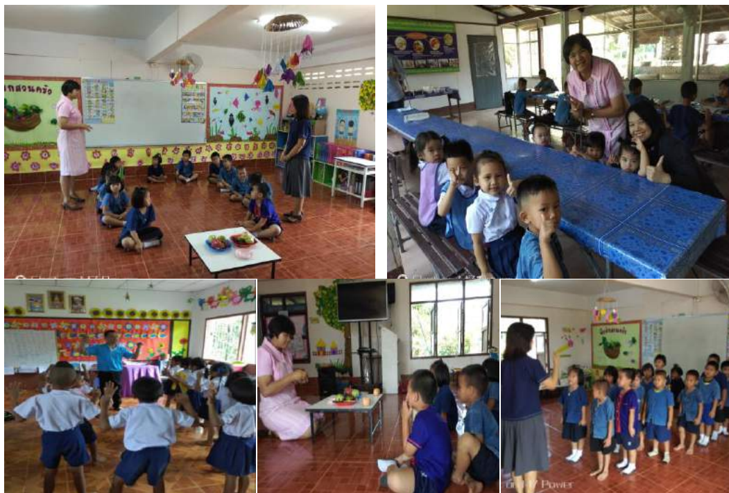
การนิเทศ ติดตาม สังเกตการสอน การพัฒนากระบวนการจัดกิจกรรมการเรียนรู้ครูปฐมวัย

อีกทั้งครูไม่มีคุณวุฒิทางด้านวิชาชีพครู ส่วนในการจัดการเรียนการสอน ครูยังไม่มีเทคนิควิธีการจัดการเรียนการสอน การประเมินพัฒนาการยังไม่หลากหลาย การจัดสภาพแวดล้อมในห้องเรียนไม่เอื้อต่อการเรียนรู้ของเด็ก การผลิตสื่อการสอนยังไม่หลากหลายและเพียงพอต่อจำนวนเด็กเนื่องจากงบประมาณไม่เพียงพอ