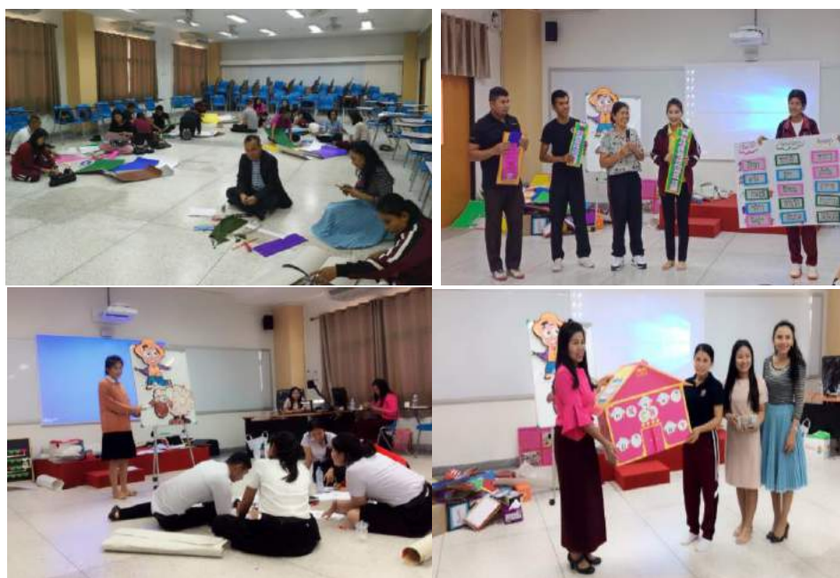
กิจกรรมสร้างสื่อการสอนภาษาไทย การนำเสนอผลงาน และการสาธิตการใช้สื่อประกอบการสอน