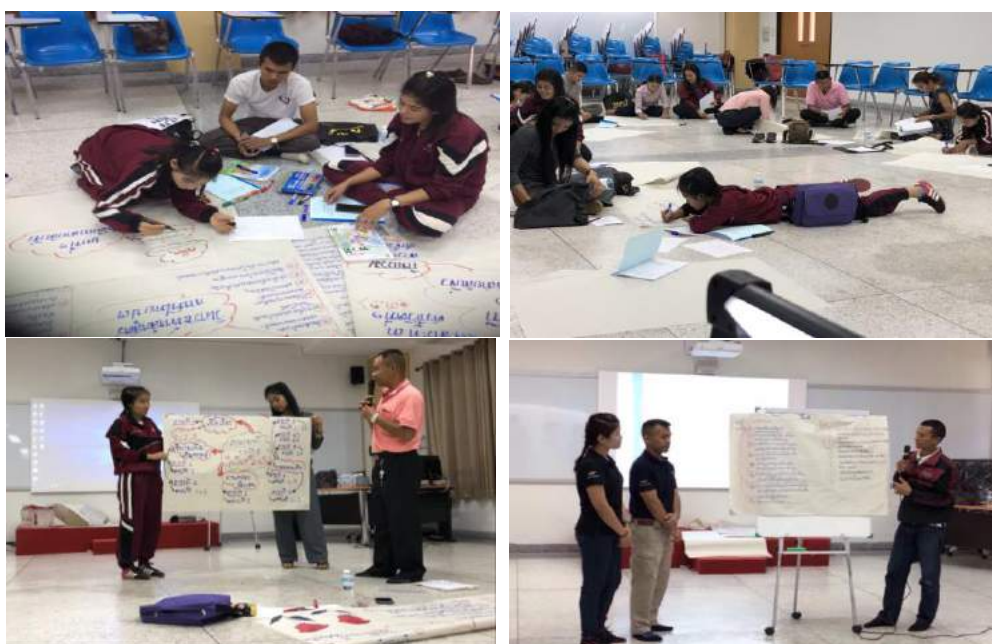
กิจกรรมวิเคราะห์หลักสูตรภาษาไทย วิเคราะห์หนังสือเรียนภาษาไทย และนำเสนอผลงาน