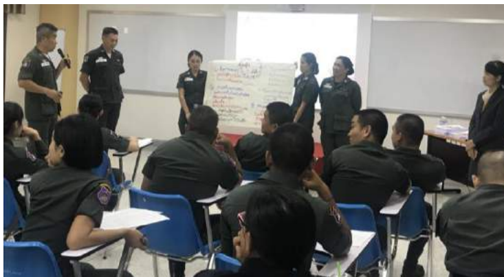
สะท้อนผลการจัดการเรียนการสอนวิชาคณิตศาสตร์ก่อนการอบรม