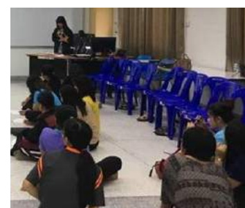
การเขียนแผนการจัดประสบการณ์และการวิเคราะห์ ๖ กิจกรรมหลัก