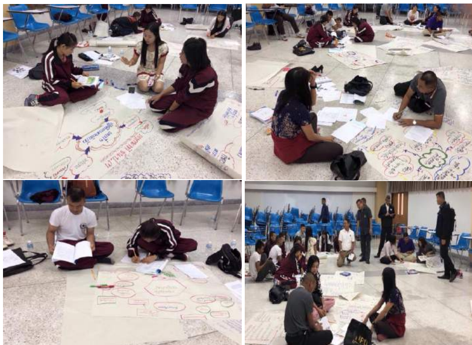
กิจกรรมการออกแบบการจัดการเรียนการสอน และการเขียนแผนการสอน