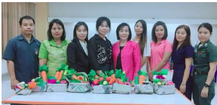
กิจกรรมผลิตสื่อการสอนจากกระดาษ (ผัก ผลไม้)