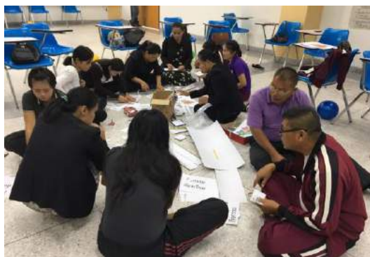
สร้างสื่อการจัดการเรียนรู้เพื่อพัฒนากระบวนการคิดทางคณิตศาสตร์ ของนักเรียนระดับชั้นประถมศึกษาปีที่ ๑-๒