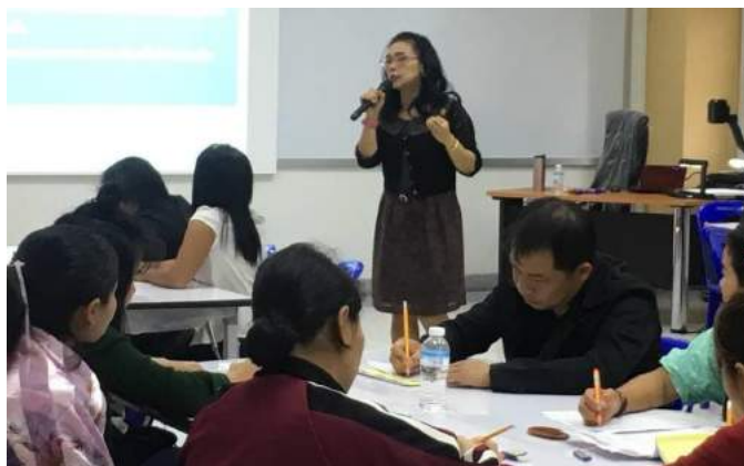
กิจกรรม การวัดการประเมินผลตามสภาพจริงของเด็กปฐมวัย