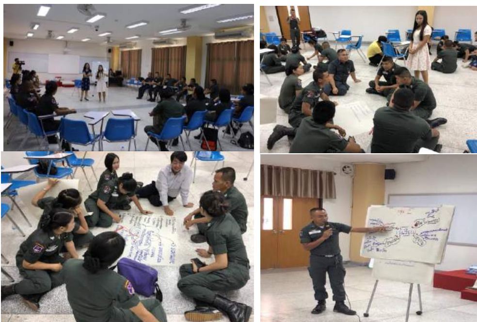
กิจกรรม PLC ครูโรงเรียนตำรวจตระเวนชายแดน และนำเสนอผลงาน

แผนการสอน สื่อ และวิธีการสอน ตามที่ครูได้วางแผนไว้ ครูทุกคนร่วมเป็นนักเรียน อาจารย์ผู้เชี่ยวชาญให้ข้อเสนอแนะ กิจกรรมนี้ทำให้ครูสามารถจัดการเรียนการสอนได้อย่างน่าสนใจ มีความมั่นใจในการสอนรูปแบบใหม่ ทำให้ครูมีทัศนคติที่ดีต่อการสอนภาษาไทย และสะท้อนให้เห็นว่ากิจกรรมที่จัดขึ้นในการอบรมเชิงปฏิบัติการตั้งแต่วันแรกจนถึงวันสุดท้ายสามารถจัดการองค์ความรู้ให้กับครูได้จริง