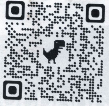
QR CODE สมัครอบรม จป.หัวหน้างาน