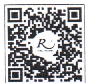
QR CODE สำหรับจองห้องพัก มหาวิทยาลัยศิลปากร