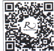
QR CODE สำหรับจองห้องพัก มหาวิทยาลัยศิลปากร

การสำรองห้องพัก ท่านสามารถจองห้องพักกับทางโรงแรมโดยสแกน QR-Code สำหรับจองห้องพัก หากท่านจองห้องพักภายหลังห้องพักอาจเต็มได้ และอาจจะไม่ได้ห้องพักราคาพิเศษซึ่งเป็นอัตราค่าที่พัก โรงแรมรอยัลริเวอร์ ๒๑๙ ซอยจรัญสนิทวงศ์ ๖๖/๑ แขวงบางพลัด เขตบางพลัด กรุงเทพฯ ๑๐๗๐๐ โทรศัพท์: ๐๒-๔๒๒-๙๒๒๒ โทรสาร : ๐๒-๔๓๓-๕๘๘๐ E-mail : rsvn@royalriverhotel.com